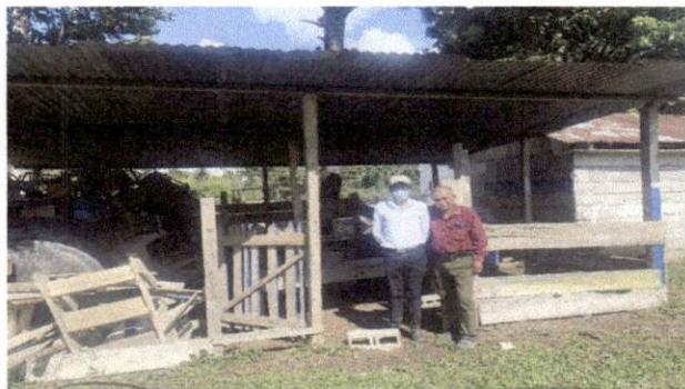
Foto 3: Ingeniero y director de establecimiento fuera de cocina donde no se observa canal de agua ni bajadas de agua.