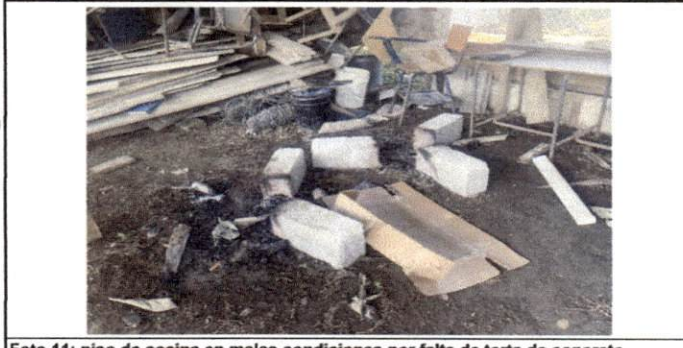
Foto 11: piso de cocina en malas condiciones por falta de torta de concreto.